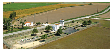
Alenquer Lezírias e Ota

Na natureza, a água pode parecer limpa mas contém impurezas, pelo que toda a água captada necessita de ser tratada antes de ser distribuída.