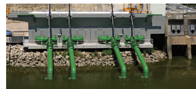
Rio Tejo Valada Tejo